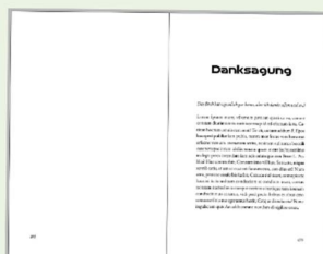
Leerseite + Danksagung