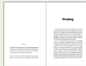
Leerseite (oder ein Hinweis) + Anfang