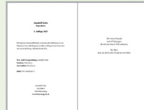
Impressum + Widmung